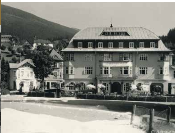
V hotelu Central sídlila partizánská slupina Nikolaj, zde byli vězněni a mučeni muži popravení na Věřině cestě v průběhu května 1945.

toněmeckého Freikorpsu. Také zde během války Češi zažili, co to je být člověkem druhé kategorie. Společnost během války pod tlakem bezpráví a násilí nacistického režimu otupěla a ztratila vůli k obraně pravé lidské svobody jednotlivce, naopak rostla touha po pomstě.