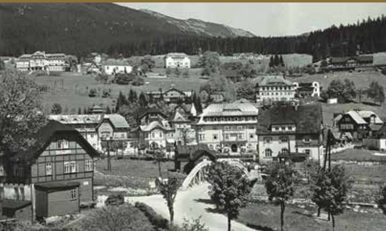
Špindlerův Mlýn kolem roku 1945

Události z konce druhé světové války a z bezprostředně následujících dní byly dlouho přikryty rouškou mlčení. V posledních desetiletích je tato rouška poodhalována a pohled to není věru pěkný. Jedním z dějišť truchlivého příběhu je i Věřina cesta. Zde byl bez soudu popraven větší počet německých obyvatel Špindlerova Mlýna, a zřejmě i příslušníků německých uniformovaných jednotek, kteří se zde na konci války nacházeli.