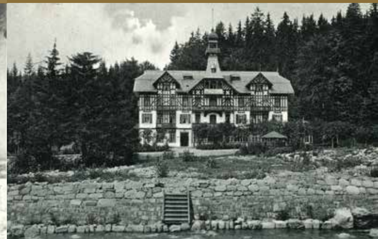
Hotel Savoy v Bedřichově byl základnou jednotky československé armády, kde byli vězněni a mučeni muži popravení na Věřině cestě 22. června 1945.