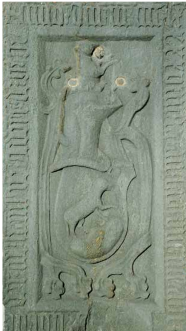
Náhrobní kámen ze Steinfeldu v Korutanech datovaný rokem 1499 měl patřit Gendorfovi předkovi. Nese jednoduchou variantu rodového znaku s ovci ve skoku

Byl jedním z pěti dětí Hanse Kostela. Kryštof měl podle dochovaných pramenů 3 bratry (Hanse, Hieronyma a Ludwiga) a sestru Katharinu.