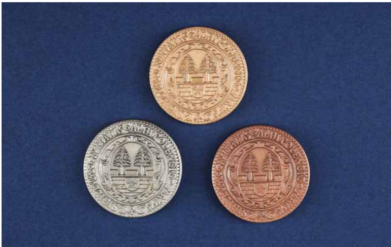
Pamětní mince ražené městem Vrchlabí k čtyřstému šedesátému výročí roku 1993 nesou na aversu otisk historické pečeti města, na reversu pak kopii jedné z Gendorfových pamětních medailí