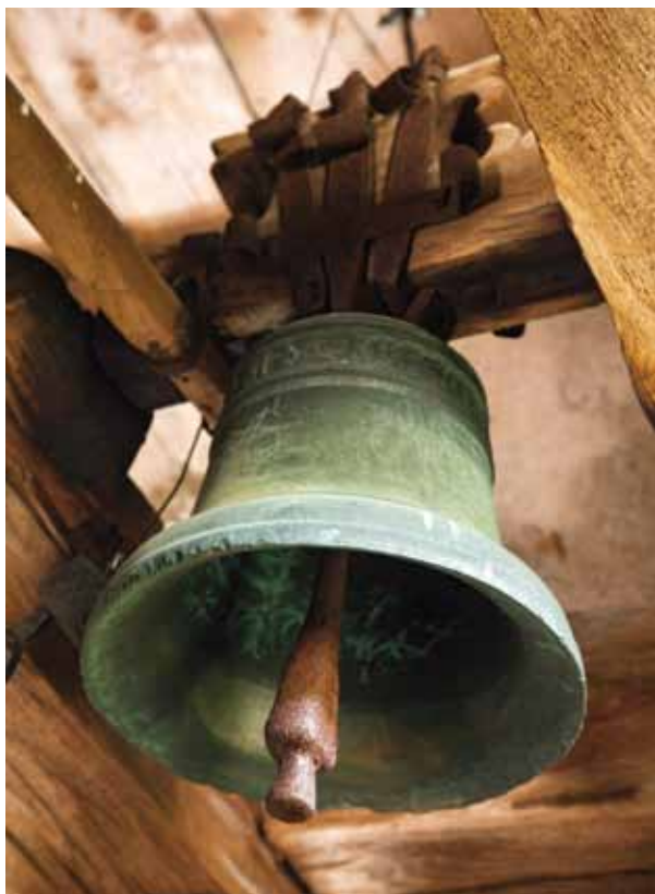
Památkou na přízeň, kterou Nové Vsi neboli Černému Dolu věnoval Kryštof Gendorf je tento zvonek z roku 1561, jenž nese jméno i znak donátora

Na svých panstvích může zřizovat nové hornické osady a města. V těchto osadách a městech musí každé těžařstvo a každý důl odevzdávat obci jeden kukus (podíl těžby) na podporu církve a chudých, kteří byli poškozeni při práci v dole, a jeden kukus obci. Gendorfovi a jeho následovníkům mají všechna těžařstva a doly odevzdat čtyři kukusy podle tzv. „Jáchymovského vzoru“ (tzn., že tyto podíly jsou odevzdávány navíc k oné 1/3 vytěžených rud pro Gendorfa) po celou dobu, co se v dole bude pracovat. Za ně náhradou dostanou těžařstva z Gendorfových lesů zadarmo dŮlní a stavební dříví.