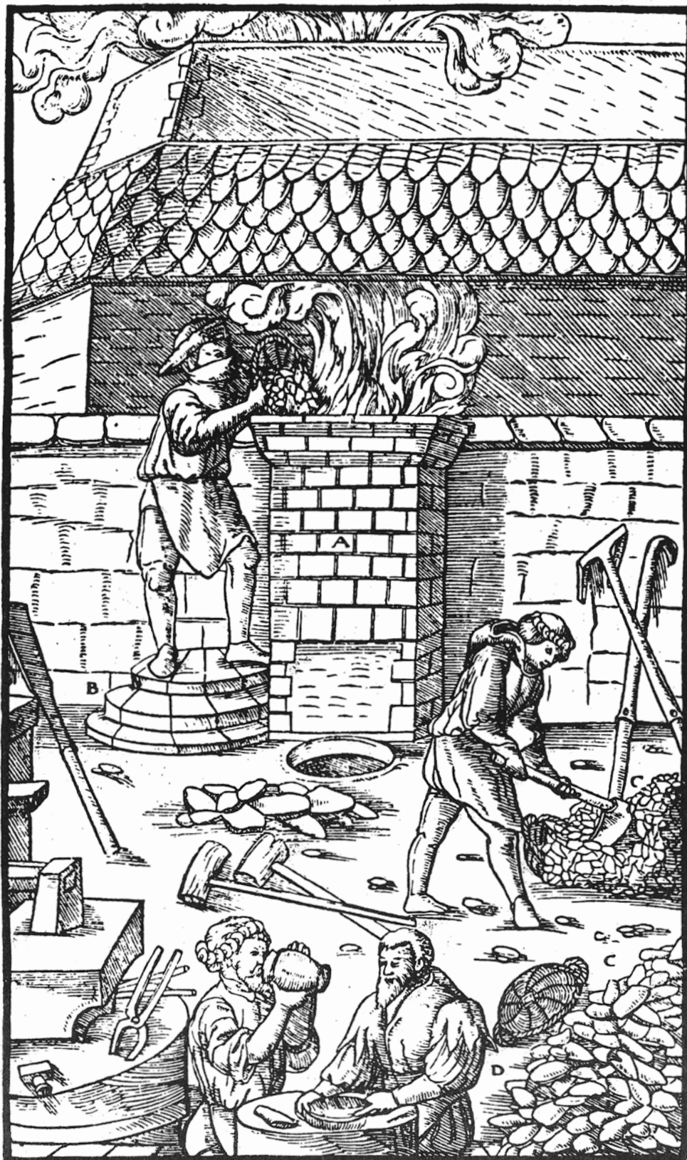
K tavení železné rudy se v Gendorfově době používaly podobné poměrně malé pece, vysoké se u nás rozšířily až později. J. Agricola