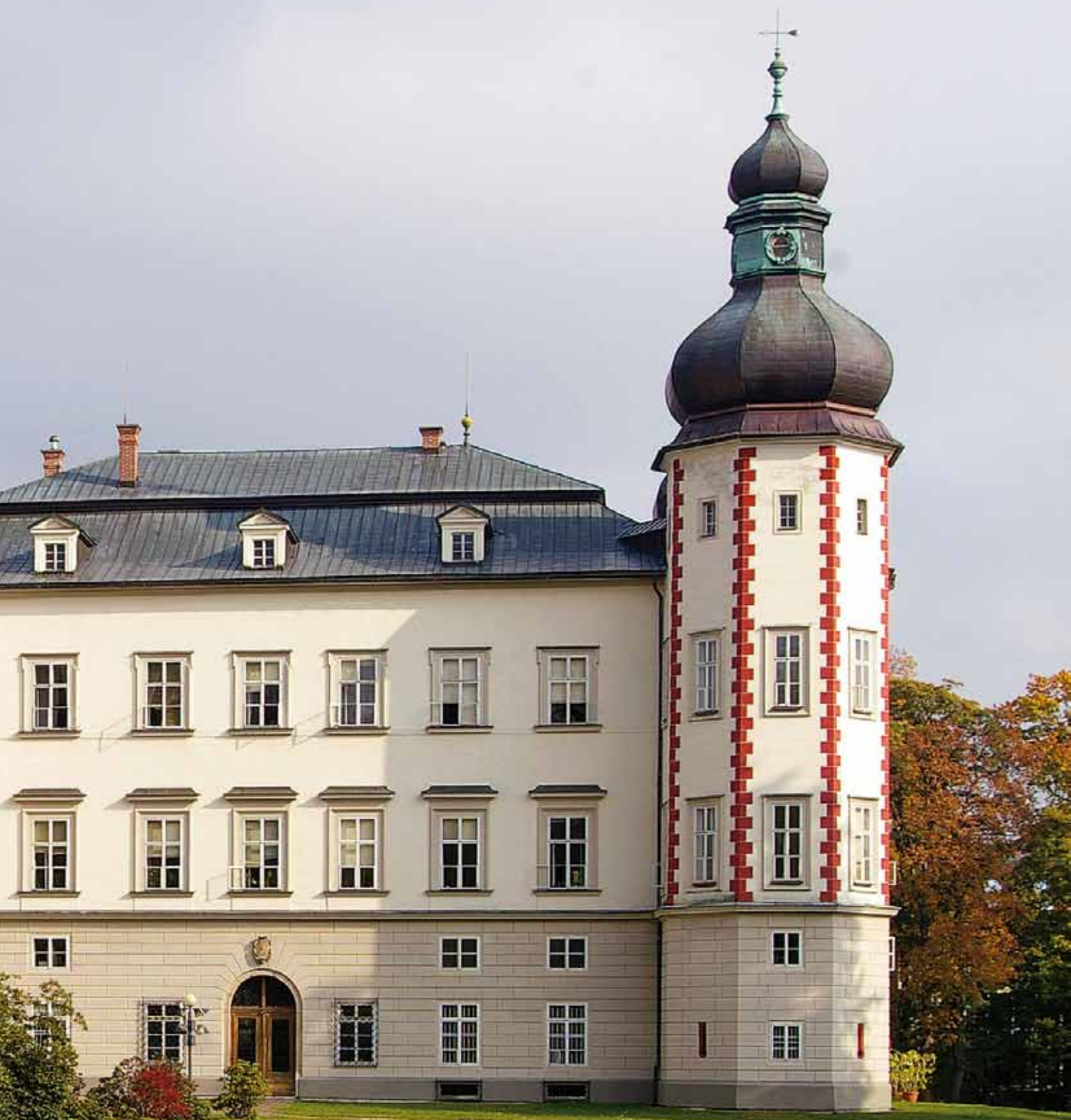
Vrchlabský zámek zbudoval Gendorf nově roku 1546 vedle staré tvrze. Charakteristický vzhled se čtveřicí nárožních věží mu však nejspíš dodali až Miřkovští ze Stropčic na počátku 17. století