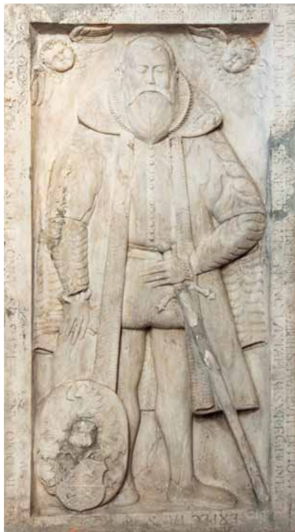
Gendorfův sok z nejzavilejších, Jiří z Valdštejna, děd slavného vojevůdce Albrechta, je pohřben v děkanském chrámu v Hostinném.

I když Gendorf v Trutnově po řadě let chaotické správy nastolil pořádek a zasloužil se o tak rozsáhlou výstavbu a tím i o rozkvět města,