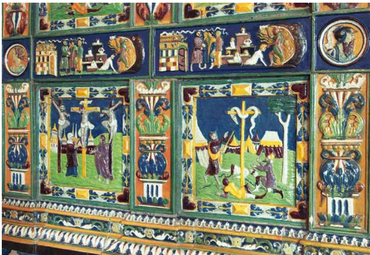
Za nádherná barevná majoliková kamna z roku 1545 mohl Gendorf vděčit svému zeti Zikmundovi Bockovi z Hermsdorfu. Ve vrcholu totiž nesou znak knížete Fridricha II. Lehnicko – Břežského, v jehož službách se Bock nacházel

s hlavicemi, jejich tělo je rozděleno na dvě části. Náměty a velikosti kachlů jsou v obou dvou částech téměř shodné. Základní řádkové kachle zobrazují dva motivy: ukřižování Krista se dvěma lotry a vztyčení bronzového hada Mojžíšem. Ač jsou náměty těchto kachlů o rozměru cca 45 × 48,5 cm stejné, jejich barevné provedení se liší.