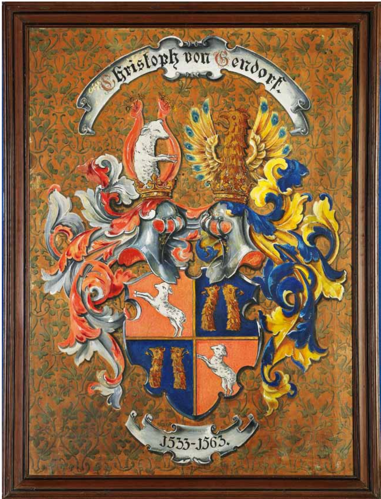
Erb Kryštofa z Gendorfu