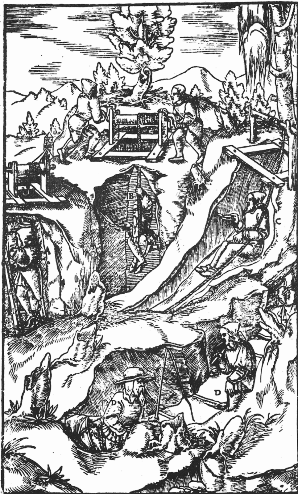
Žebříky, svislé i šikmé rumpály, vylámané schody, lidská i zvířecí síla – tak si lidé pomáhali při pohybu v náročném prostoru štol, šachet a dobývek. Vyobrazení z díla Jiřího Agricoly