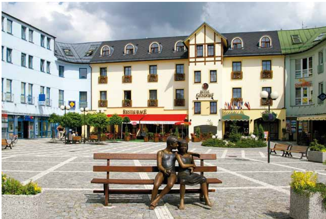
Gendorfovo jméno dostal i nový hotel ve Vrchlabí na Evropském náměstí z přelomu 20. a 21. století

Další část trutnovské zástavy tvořil hrad s městečkem Žacléř a přilehlé vsi. Tuto zástavu oficiálně Gendorf prodal svým šesti provdaným dcerám (Paule, Eustachii, Benigně, Kordanii, Eleonoře a Lukrecii) již roku 1553. Snad šlo o jistou formu vypořádání věna.