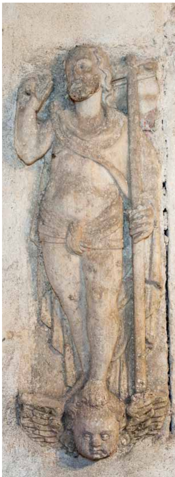
Reliéfy spravedlnosti a zmrtvýchvstalého Krista nejspíš zdobily později zaniklý hrob Kryštofa Gendorfa ve vrchlabském kostele