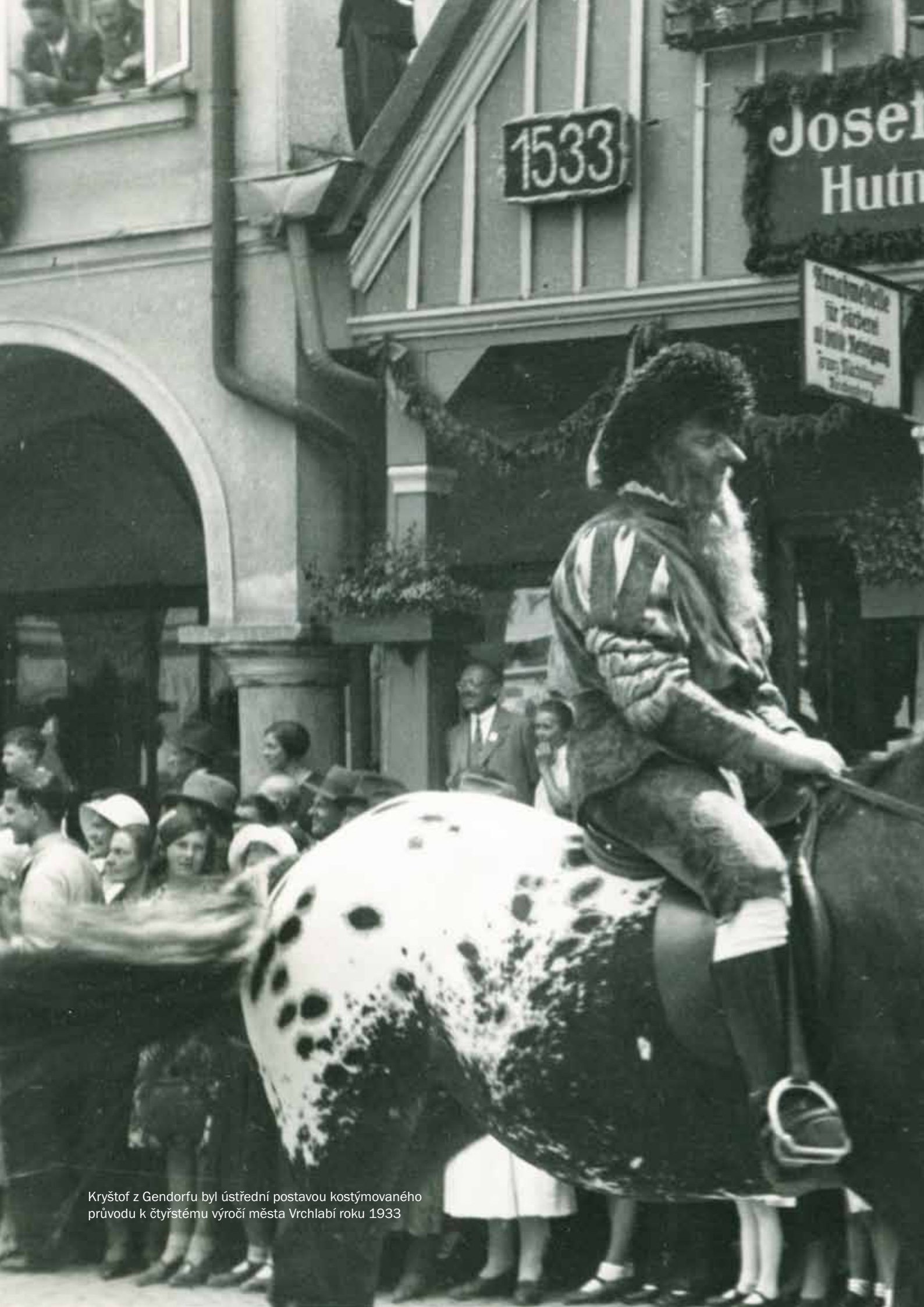
Kryštof z Gendorfu byl ústřední postavou kostýmovaného průvodu k čtyřstému výročí města Vrchlabí roku 1933