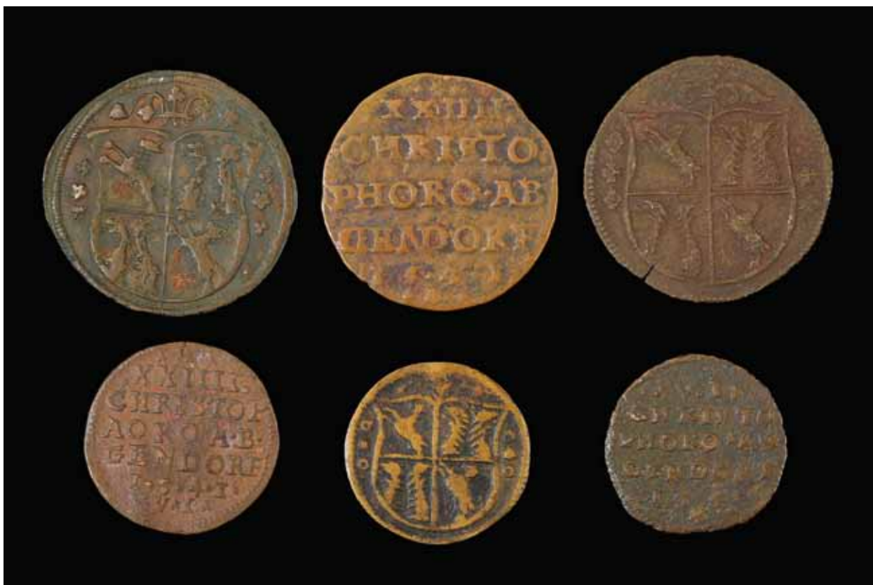
Sada početních mincí s různými nominály určených pro vnitřní oběh na Gendorfových panstvích dokládá promyšlený systém hospodaření

existovaly však větší i menší ražby. V aversu je vyražen Gendorfův erb a v reversu Gendorfovo jméno jako nápis. Pod jménem byl vyražen rok vydání. Nad nápisem jsou různé římské číslice, které pravděpodobně vyjadřovaly nominální hodnotu mince. Z let 1534 a 1541 jsou známé ražby s čísly III, VI, VIII a XXIII. Šlo pravděpodobně o místní platidlo. Mohlo jít i o určitou náhradu z důvodu nedostatku drobných mincí. Rovněž by se tyto peníze mohly označit jako výplatní známky nebo žetony. Ale na rozdíl od jiných známek a žetonů doložených na jiných panstvích, byly ty Gendorfovy vyráženy po obou stranách. Je však nanejvýš pravděpodobné, že za toto zvláštní platidlo mohli obyvatelé nakupovat pouze na zdejších panstvích.