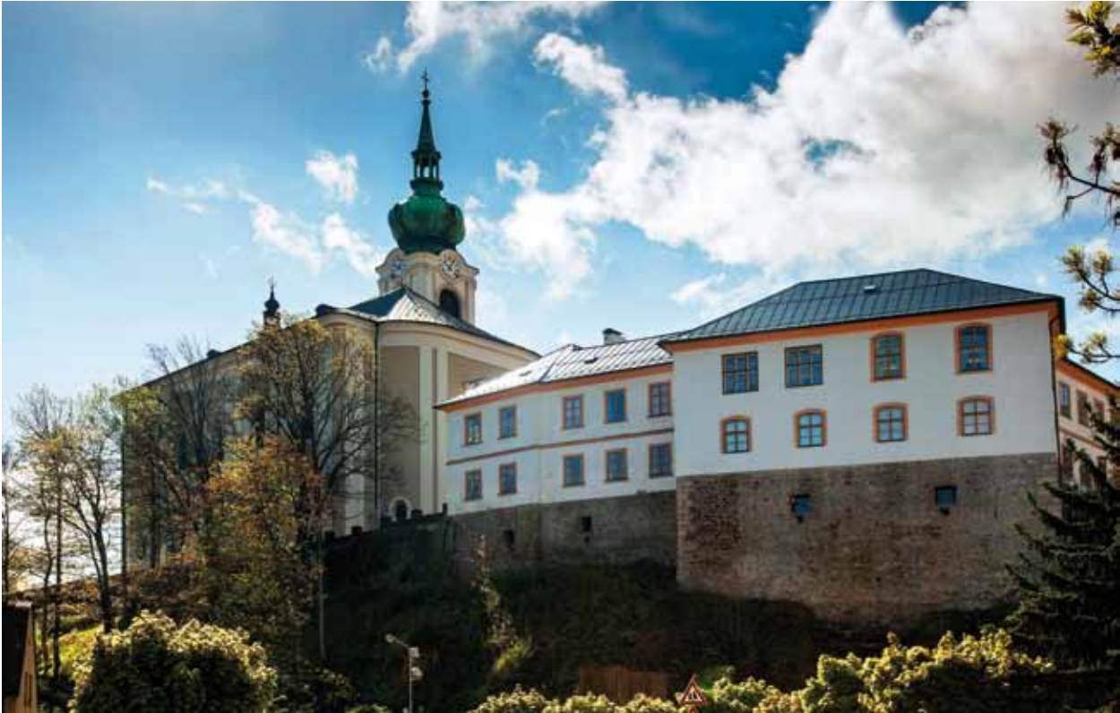
Královský hrad Trutnov Gendorf po roce 1538 přestavěl na své příležitostné sídlo. Dnes se na jeho místě nachází Muzeum Podkrkonoší

Kryštof z Gendorfu ihned po koupi Vrchlabí začal intenzivně pracovat na zvýšení celkové úrovně Vrchlabí i okolí.