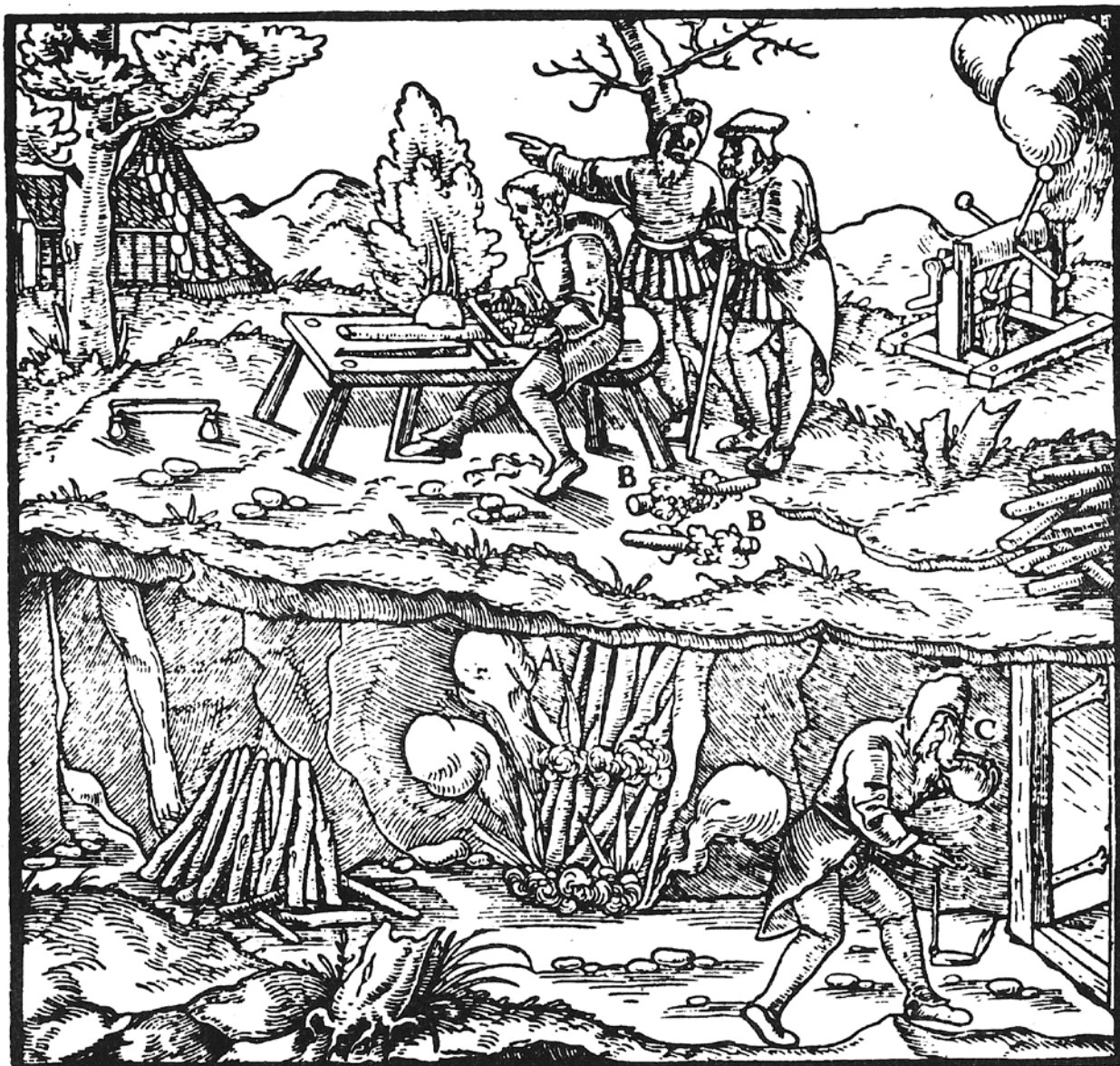
Sázení ohně na vyobrazení v soudobém díle Jiřího Agricoly

platit každý rok deset kop pražských grošů, vždy ve dvou splátkách – na den svatého Havla (16. října) a na svatého Jiří (24. dubna).