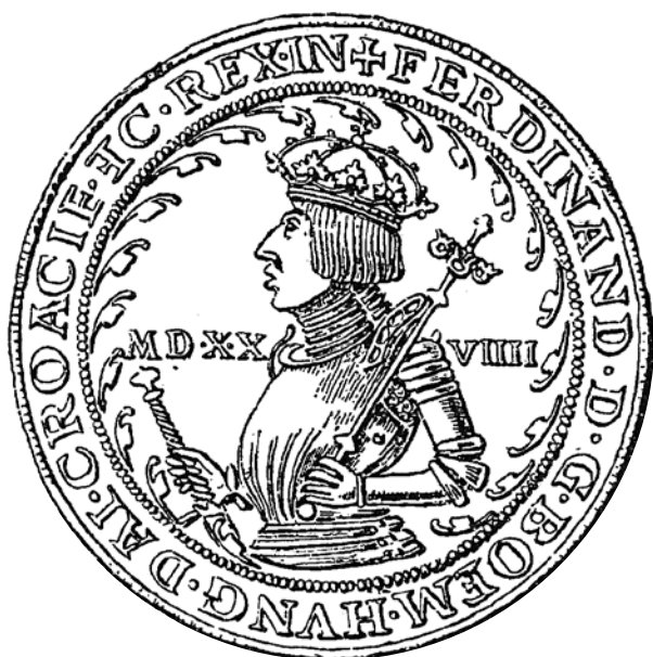
Český král Ferdinand I. Habsburský na tolaru z roku 1528, na jehož zavedení měl Gendorf významný podíl

Za velkého Gendorfova přispění vstoupila v platnost 1. dubna 1534 „pražská horní narovnání“, která byla poprvé v české historii brána jako platný celozemský zákon týkající se hornictví, resp. jako horní regál. V důsledku tohoto „narovnání“ vznikl nový mincmistrovský úřad, kvůli kterému funkce horního hejtmána pozbyla téměř veškerého významu. 10. listopadu 1535 podal Kryštof z Gendorfu rezignaci na svůj úřad, ale