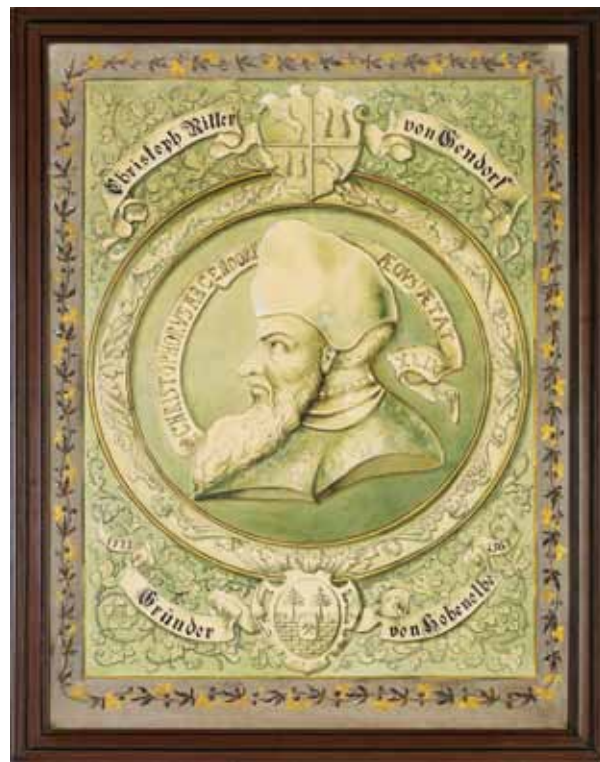
Rekonstrukce podoby Kryštofa z Gendorfu na akvarelu z první třetiny 20. století podle obrazu na pamětní minci

Velmi důležité bylo zahrazení přístupové cesty od Saska, která vedla údolím mezi dvěma kopci. Toto opevnění odolávalo nejdéle náporům protivnických vojsk. Nedlouho po návratu Gendorfova vojska z neúspěšného tažení vypukla v Jáchymově „nemalá vzpoura“. 17. listopadu 1546 umístil do tohoto opevnění Gendorf 400 vojáků k dělům. Vojáci však odmítli poslušnost a 19 dní byli opevnění nejen proti nepříteli, ale i proti svému veliteli. Vzpoura byla tedy 6. prosince