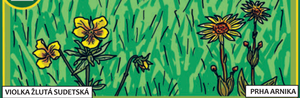
VIOLKA ŽLUTÁ SUDEŤSKÁ

KRKONOŠKÉ LOUKY BYLY ČLOVĚKEM ZALOŽENÉ NA MÍSTECH, KDE DŘÍV STÁL LES. MUSEJÍ SE PRAVIDELNĚ SEKAT, JINAK SI JE LES VEZME ZPÁTKY.